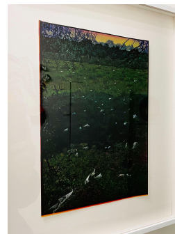
Marilou van Lierop Left Bank 2022 Pencil on print 30 x 20 cm €1.650,-