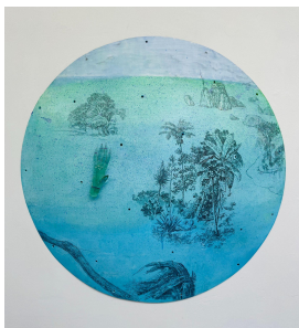
Marilou van Lierop A Blue Cloud Entering the Frame 2022 Polyester, pencil, oil paint and glass hand Ø 120 cm €6.800,-