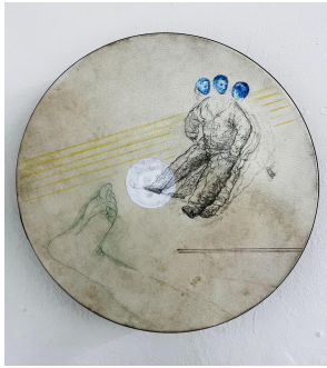
Marilou van Lierop Untitled #01 2022 Oil and pencil on small drum Ø 45,5 cm €2.400,-