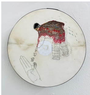
Marilou van Lierop Untitled #02 2022 Oil and pencil on small drum Ø 30,5 cm €2.200,-