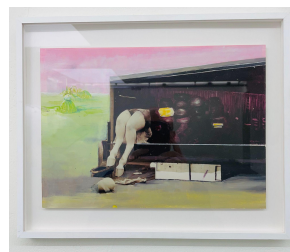
Marilou van Lierop Plants that dream 2022 Oil on paper 35,5 x 43 cm €1.950,-