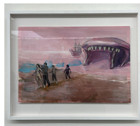
Marilou van Lierop The origins of the road 2022 Oil on paper 35,5 x 43 cm €1.950,-