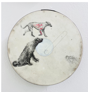
Marilou van Lierop Untitled #03 2022 Oil and pencil on small drum Ø 30,5 cm €2.200,-