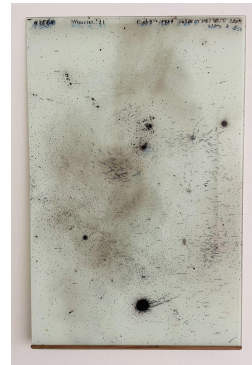
Marilou van Lierop Untitled #05 2022 Print on glass 120 x 78 cm €5.500,-