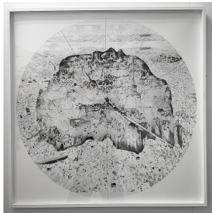
Marilou van Lierop La Possibilité d'une île II 2022 Print on paper, edition 5 + 2 AP 80 x 80 cm €2.400,-