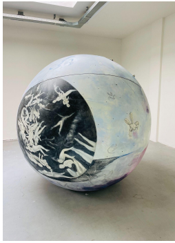
Marilou van Lierop The Unbearable Lightness of Being 2022 Acrylic on water walking ball Ø 200 cm €11.000,-