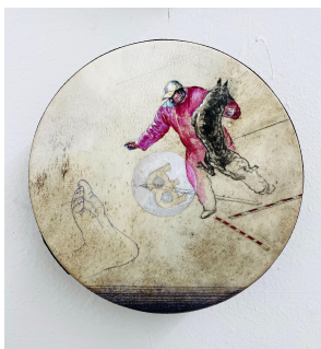
Marilou van Lierop Untitled #04 2022 Oil and pencil on small drum Ø 25 cm €2.000,-