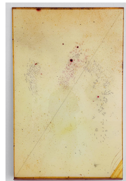
Marilou van Lierop Untitled #06 2022 Print on glass 120 x 78 cm €5.500,-