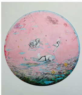
Marilou van Lierop The Ashes of the Previous Day 2022 Oil and pencil on polyester Ø 120 cm €6.800,-