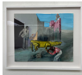
Marilou van Lierop Tolerance of Tyranny 2022 Oil on paper 35,5 x 43 cm €1.950,-