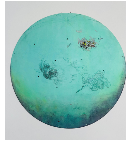
Marilou van Lierop A Troop of Princesses Beneath our Feet II 2021 Oil and pencil on polyester Ø 120 cm €6.800,-