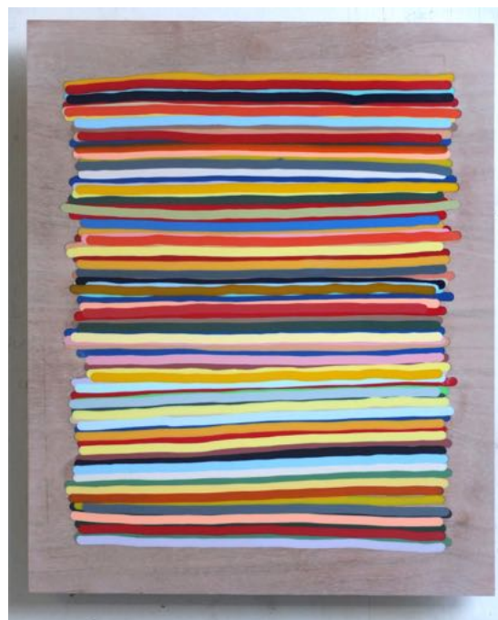
STRIPES, 2018 Epoxy in houten paneel Klein formaat – 63 x 49 cm € 1350,-