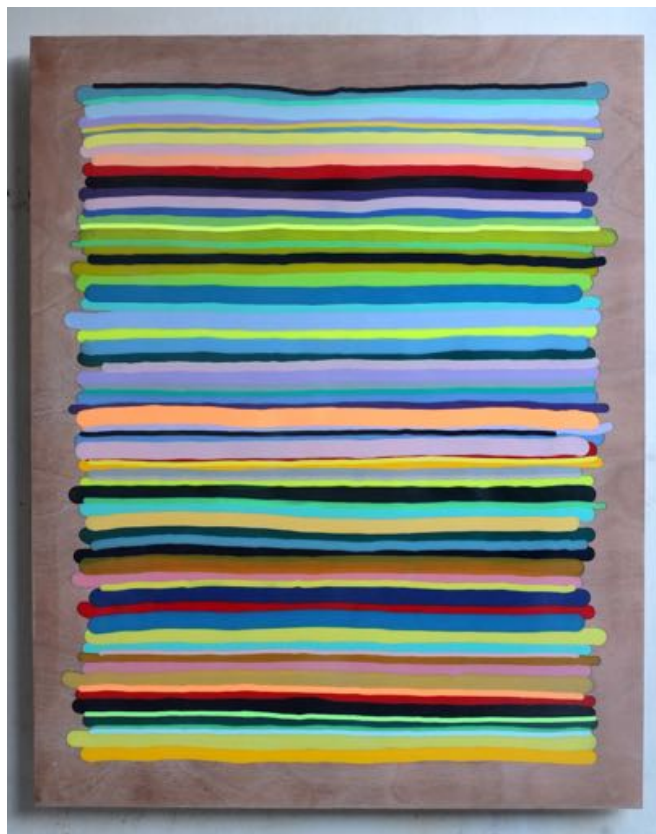
STRIPES, 2018 Epoxy in houten paneel Groot formaat – 105 x 83 cm € 2600,-