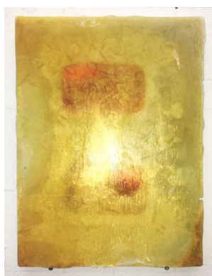
Ice paintings klein € 700,-, Installatie door de kunstenaar op datum in overleg € 950,- Ice paintings groot € 1250 Installatie door de kunstenaar op datum in overleg € 1500,-