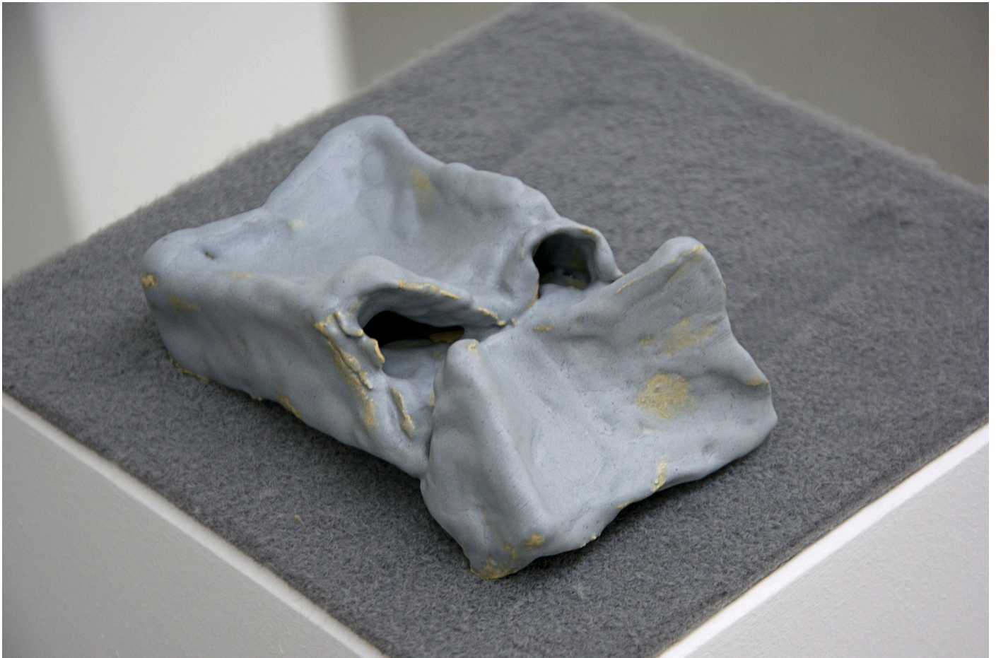
Some other memory (sketches) (detail)

Verderop in de tentoonstellingsruimte zijn meerdere van dit soort objecten te vinden, gemaakt door Ties Ten Bosch en gepresenteerd met stukken tapijt op sokkels. Zo zijn er een sigarettenpakje, een koffiebekertje en ook een colablikje te herkennen. Het zijn vooral dingen die onopgemerkte sporen van ons dagelijks leven symboliseren. Ze zijn opnieuw geformuleerd en in een nieuwe context geplaatst. Ook hier zijn de stukken tapijt weer bewerkt zodat er een veronderstelde indruk van het oorspronkelijke object zichtbaar is, alsof deze onlosmakelijk met het object verbonden is.