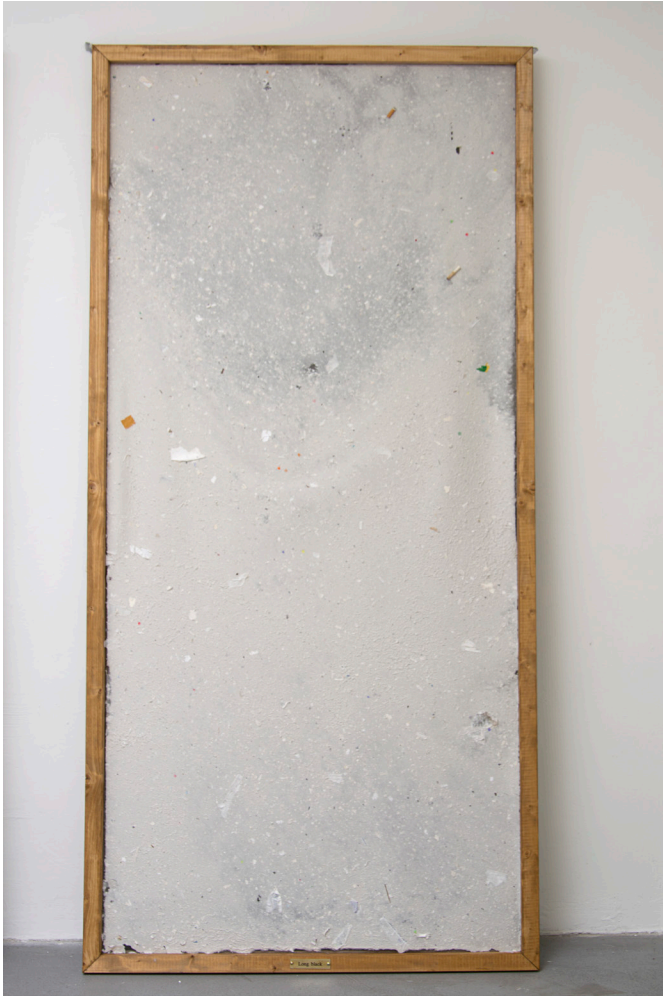
In coffee we trust (detail)