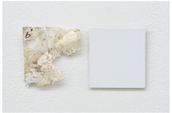
Little remains (ongoing series)