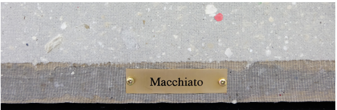
Coffee to go (Macchiato) (detail)