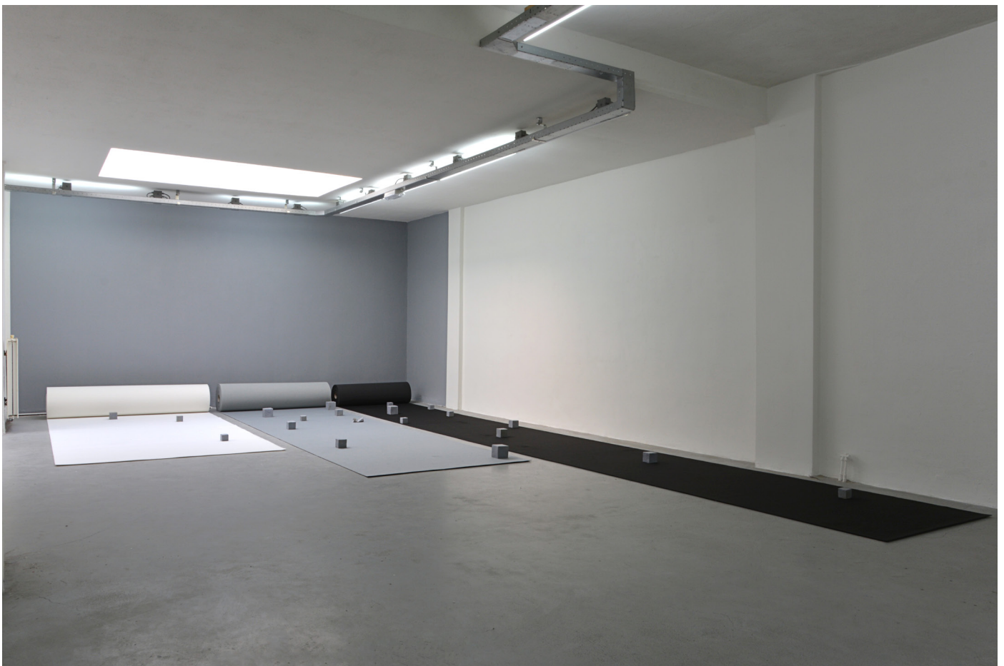
Some other memory

te denken en het onbekende zelf aan te vullen. Dit keramiek object gedraagt zich als de aanduiding van iets wat we kennen, maar is er toch geen exacte kopie van. Daardoor krijgt de toeschouwer een herinnering aan een object dat er in oorsprong nooit was.