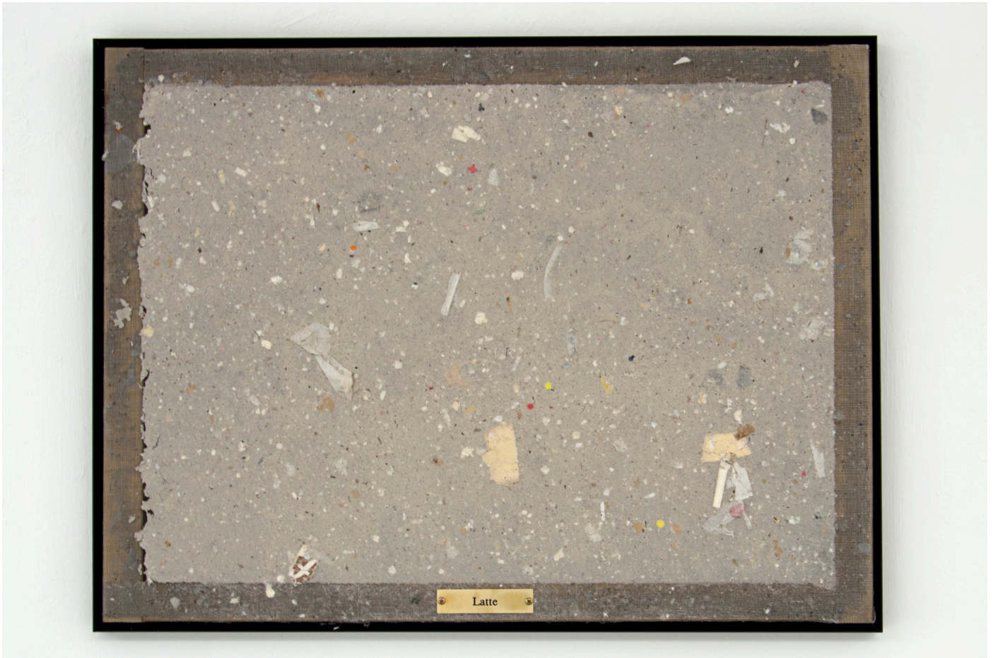
Coffee to go (Latte)