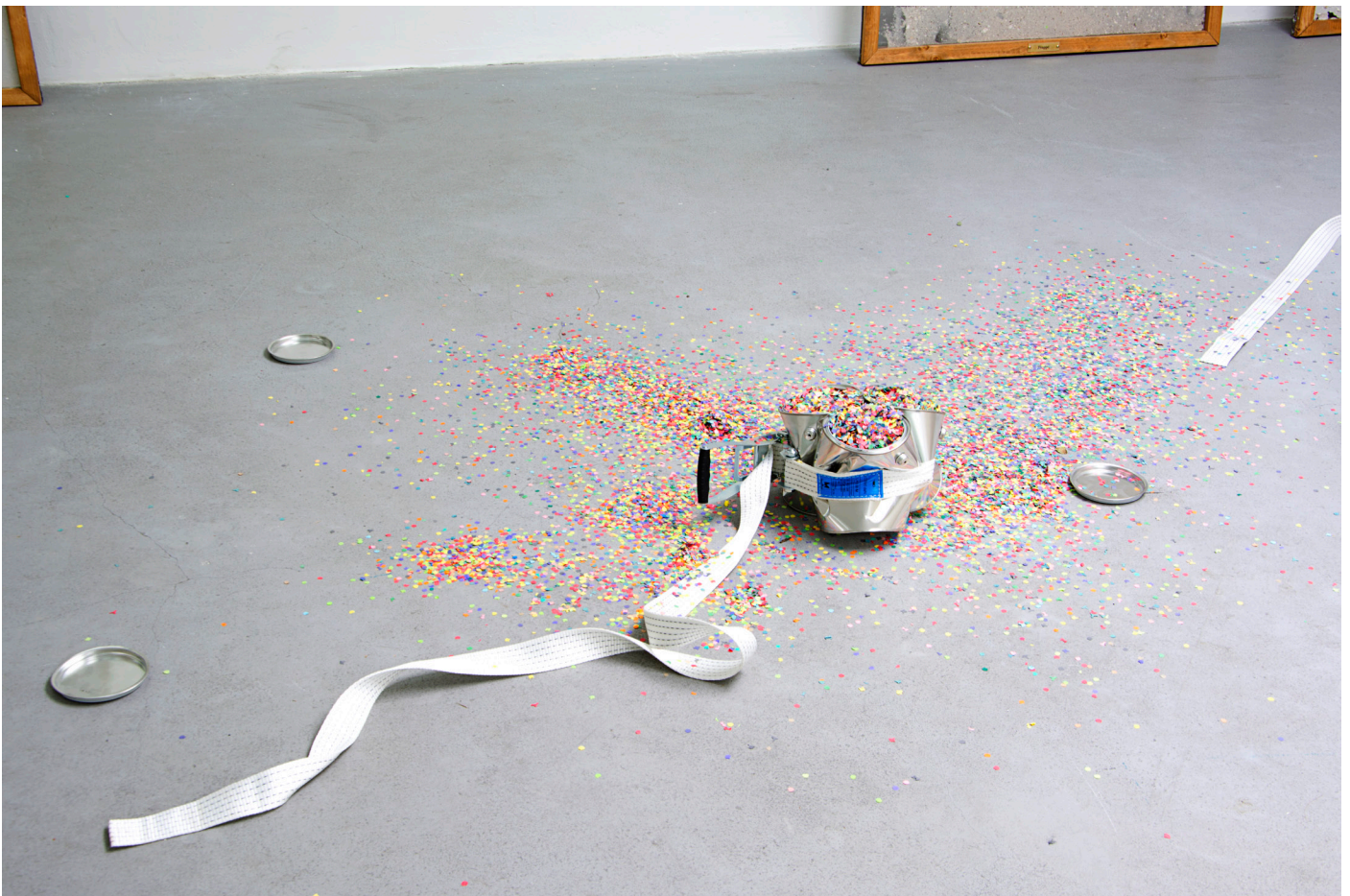
Squeezing out a party

kort moment. Het is voorbij voor je het weet. De confetti verwordt tot een spoor van de actie waarbij de blikken werden samengeknepen en geeft ons herinnering aan dat wat er is gebeurd. Het werk creëert een speelse, ontspannen sfeer die de vergankelijkheid van een moment vangt.