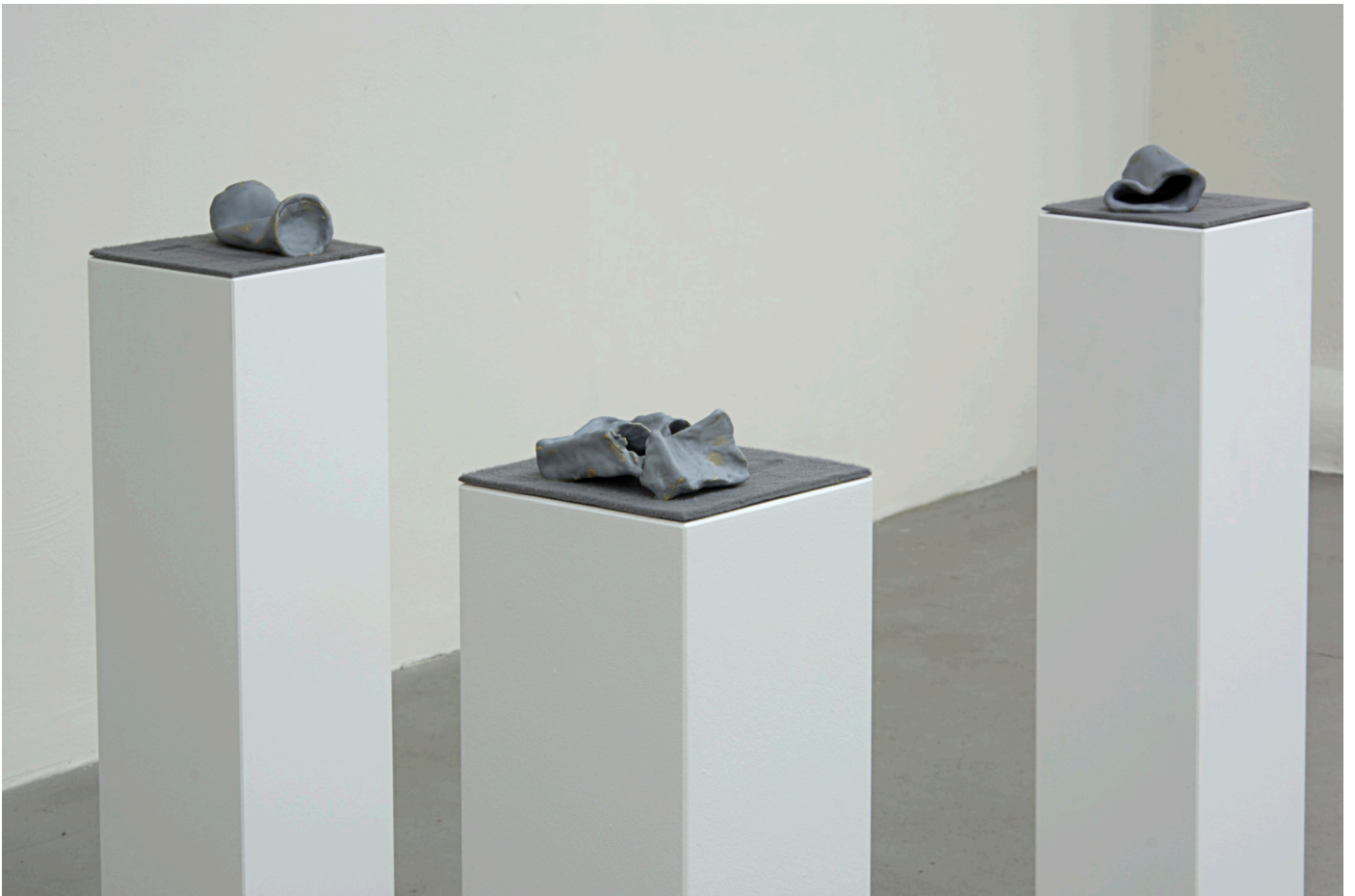
Some other memory (sketches)

For more information: www.tiestenbosch.com / tiestenbosch@gmail.com / +49 (0) 15756728186 or contact Frank Taal Gallery: www.franktaal.nl / frank@franktaal.nl / +31 (0) 850656757