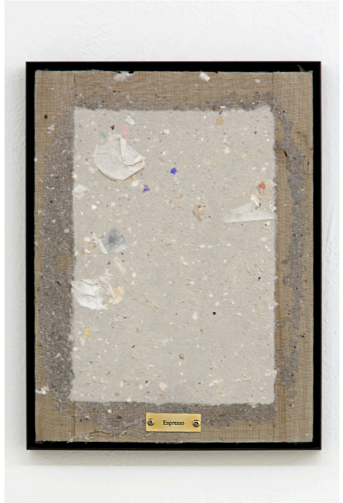
Coffee to go (espresso)