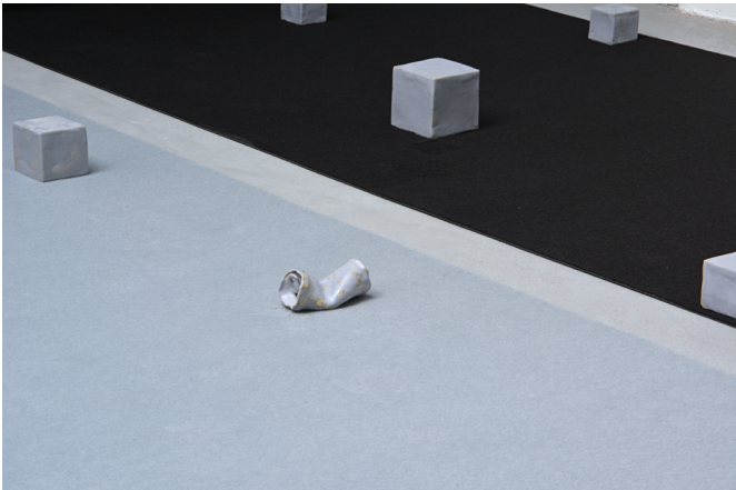
Some other memory (detail)