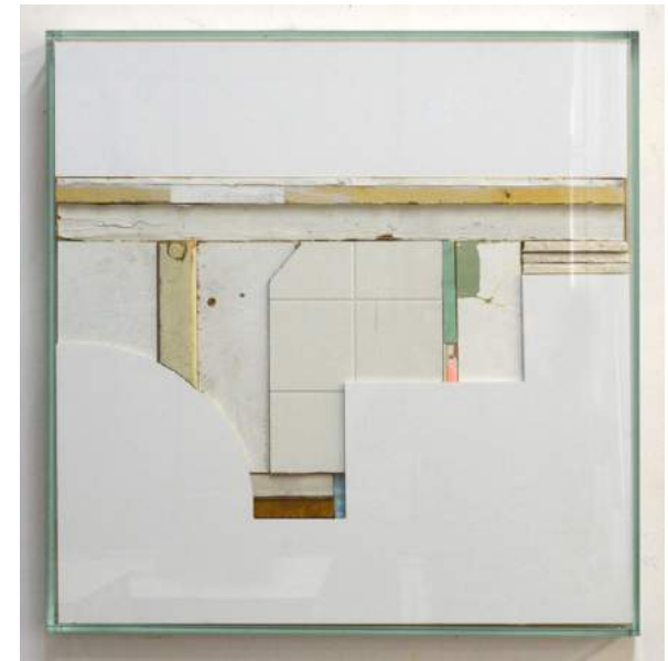
White Square #13 , 2016, wall sculpture of acrylic glass, gypsum plates, wood, paint, kapa plast foam, and styrofoam 66 x 66 x 6,5 cm, € 3.500,-