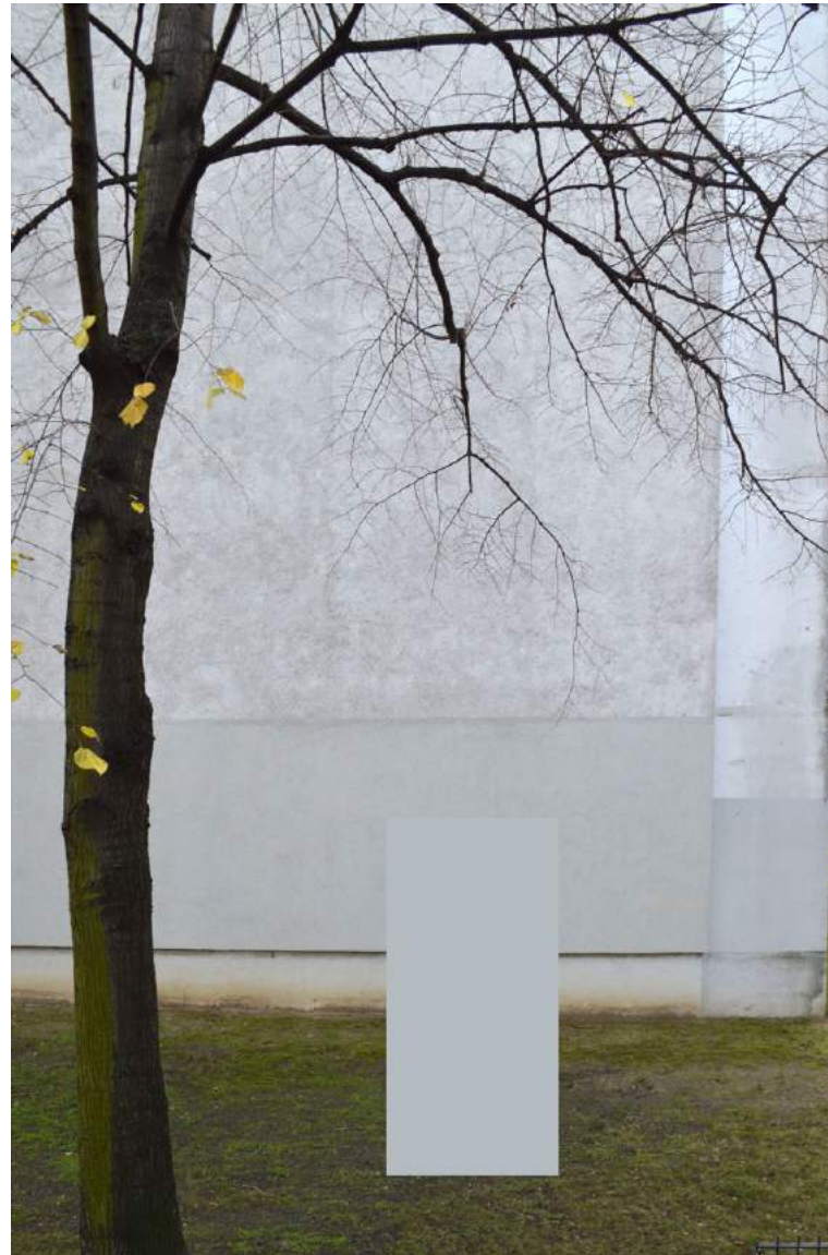
Accidental visions , Photography on dibond, 38 x 53 cm, € 800,-