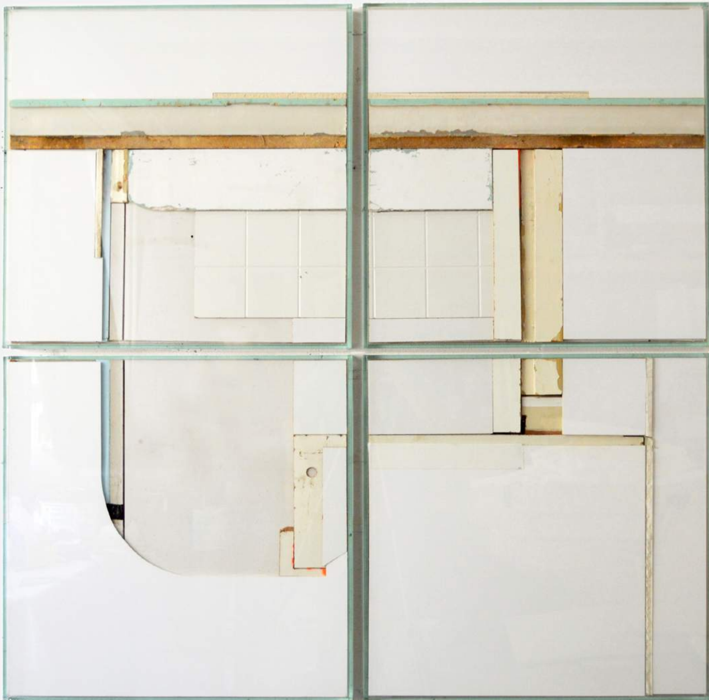
a finite slice of infinite space #8 2016, wood, glass, gypsum plates, paint, kapa plast foam, styrofoam, spraypaint, uv, protection varnish spray 136 x 136 x 6,5 cm, € 9800,-