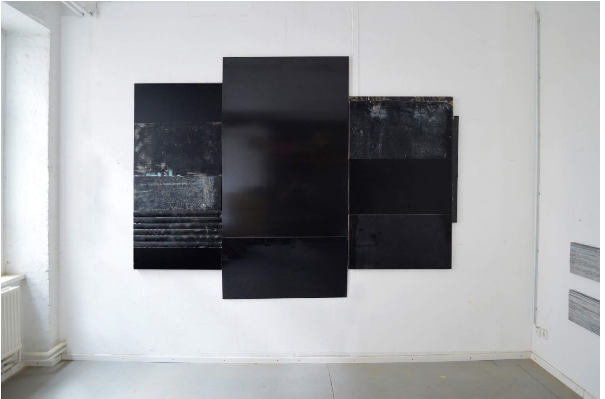
Horror Vacui , 193 x 215 x 5, wood, spraycan, high glossy black plexiglass, roller shutter, € 15.000,-