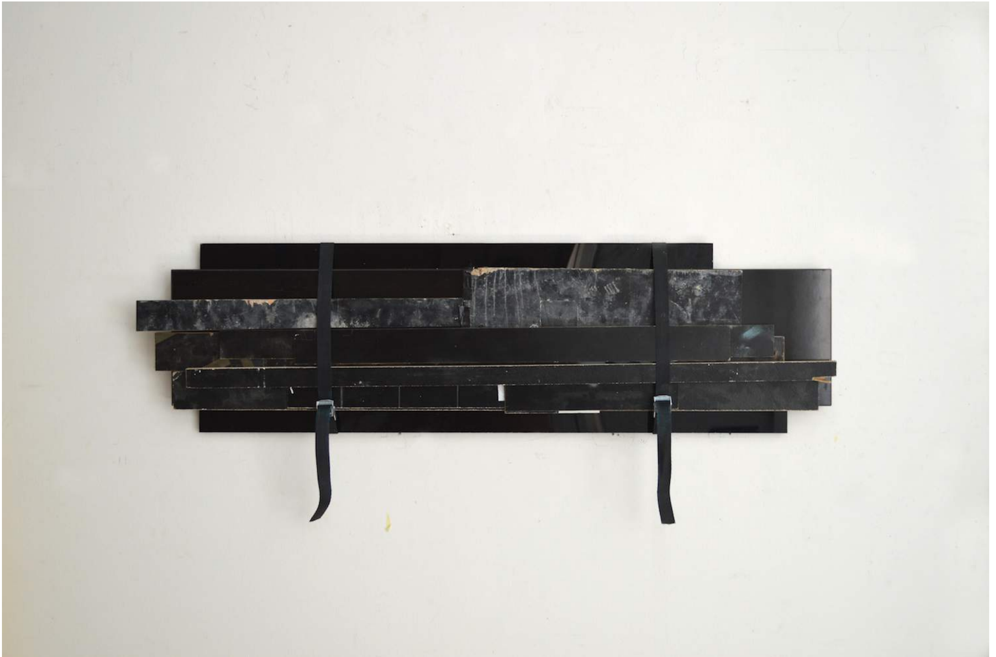
(un) control, 122 x 34 x 5 cm, wood, high gloss plexiglass, plastic, lashing strap, € 2800,-