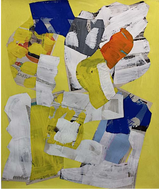
Beautiful Lie, New York, 2014 Collage on paper 107 x 127 cm (50 x 42 inch)