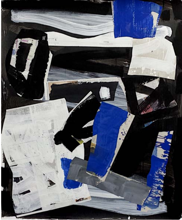
Medicine Cabinet, New York, 2014 Collage on paper 107 x 127 cm (50 x 42 inch)