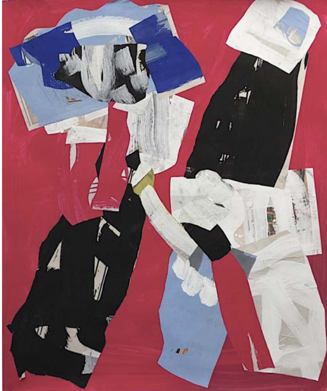
Courtship Dance, New York, 2014