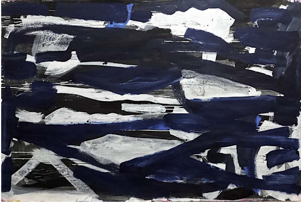
Puget sound, New York, 2014 Gouache and pigment dispersion on watercolor paper 140 x 214 cm (55 x 84 inch)