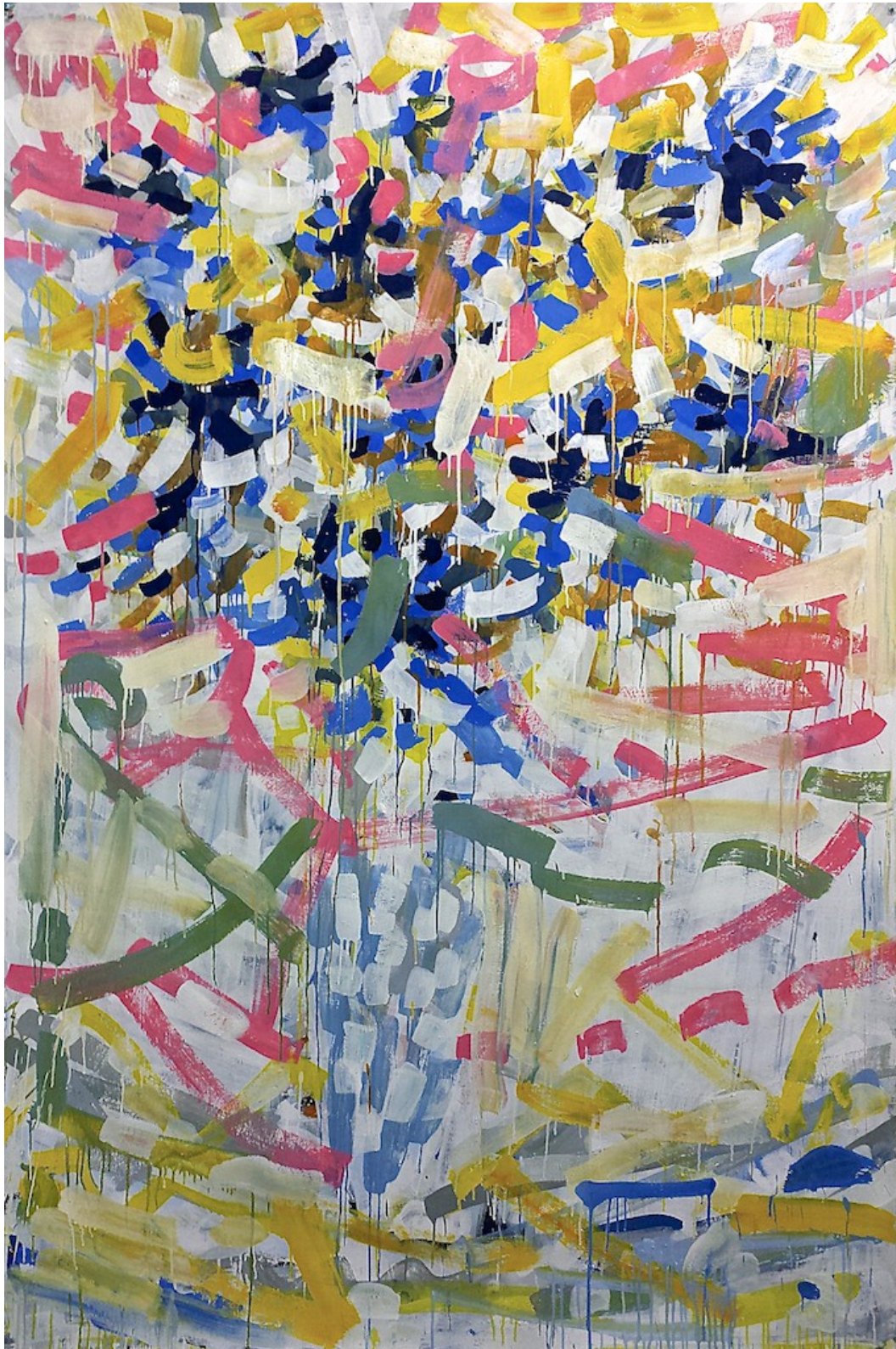
Dirty flowers, New York 2014 Gouache and pigment dispersion on watercolor paper 214 x 140 cm (84 x 55 inch)