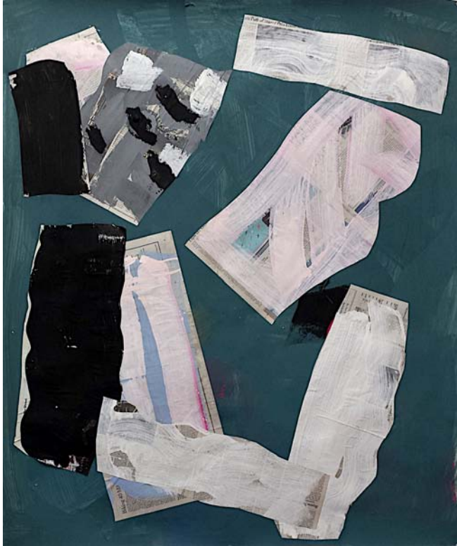
Undone, New York, 2014 Collage on paper 107 x 127 cm (50 x 42 inch)