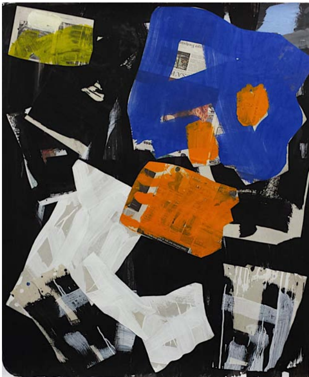
Horny Puppy, New York, 2014

Collage on paper 107 x 127 cm (50 x 42 inch)