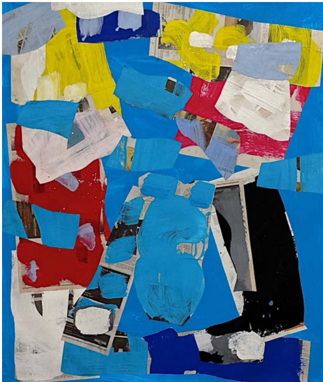
Monkey Gone to Heaven, New York, 2014 Collage on paper 107 x 127 cm (50 x 42 inch)