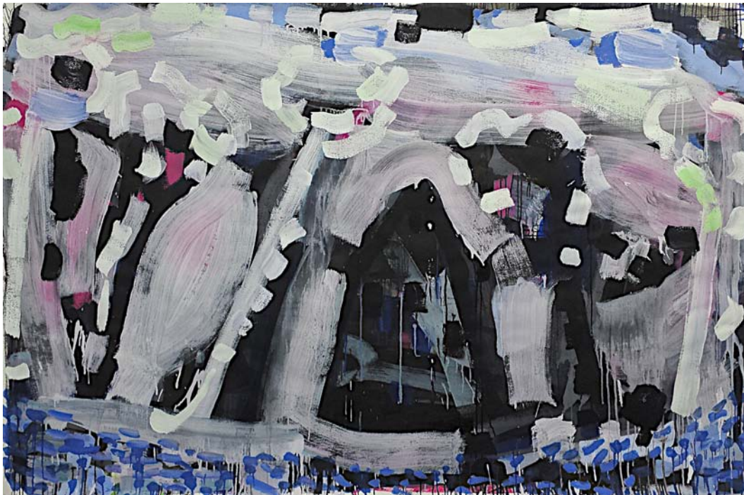
Cabin at the lake, New York, 2014 Gouache and pigment dispersion on watercolor paper 140 x 214 cm (55 x 84 inch)