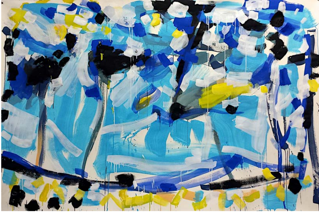
Garden, New York, 2014 Gouache and pigment dispersion on watercolor paper 140 x 214 cm (55 x 84 inch)