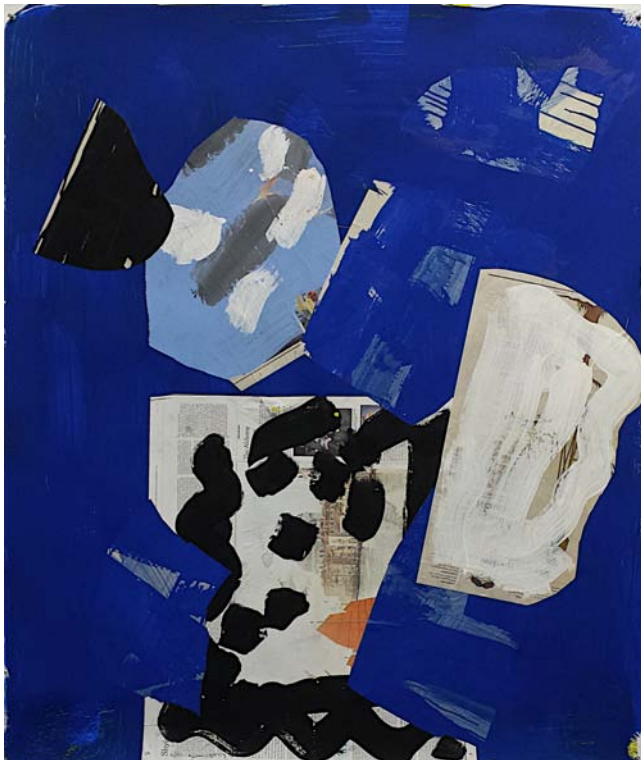
Little Stone Bird, New York, 2014 Collage on paper 107 x 127 cm (50 x 42 inch)