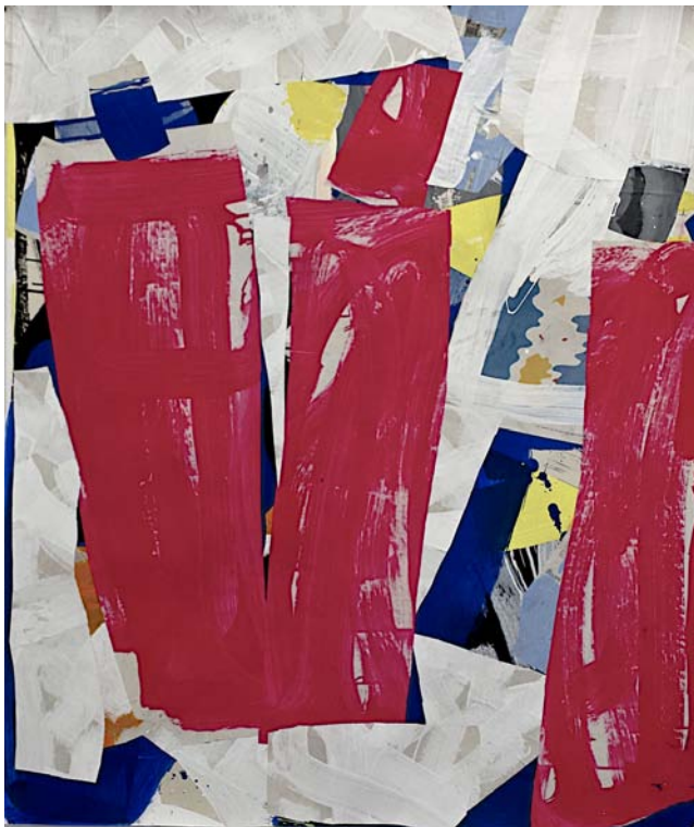
Still Life with 3 Bottles, New York, 2014 Collage on paper 107 x 127 cm (50 x 42 inch)