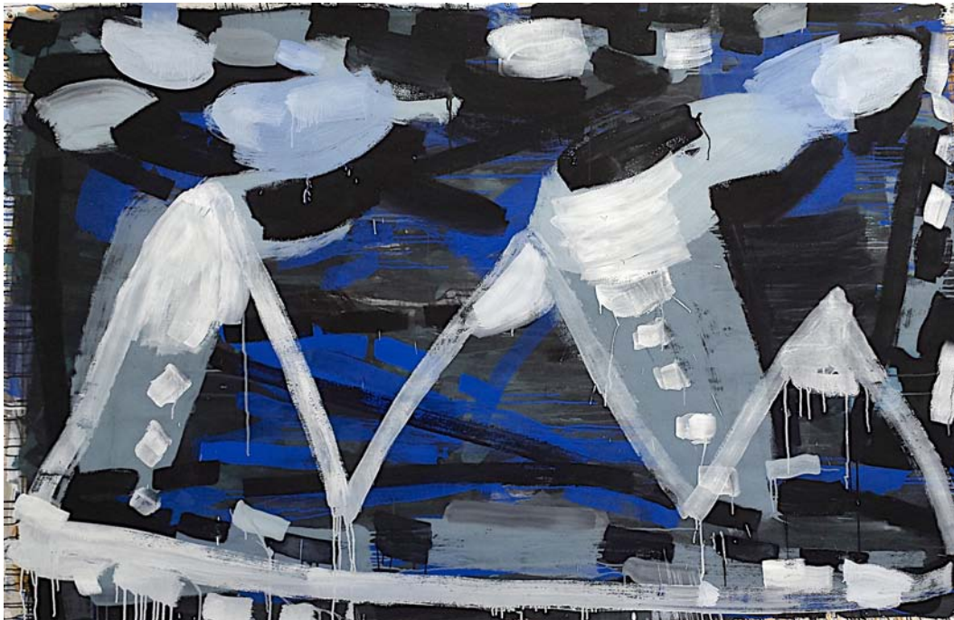
Fingers of God (snowy peaks), New York, 2014 Gouache and pigment dispersion on watercolor paper 140 x 214 cm (55 x 84 inch)