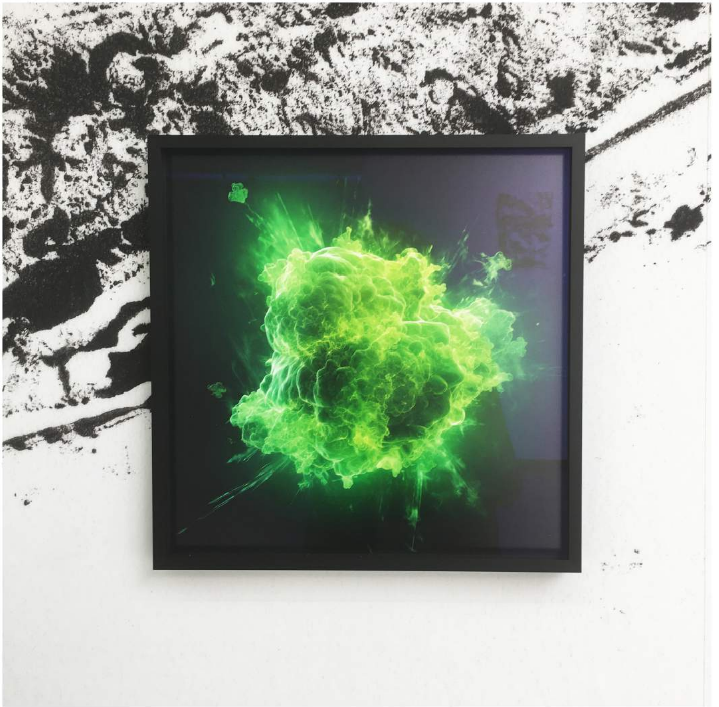
Imagine #03 (2023) Archival Pigment Print | 30 x 30 cm Edition: 3 + 1 AP | €1.200,-