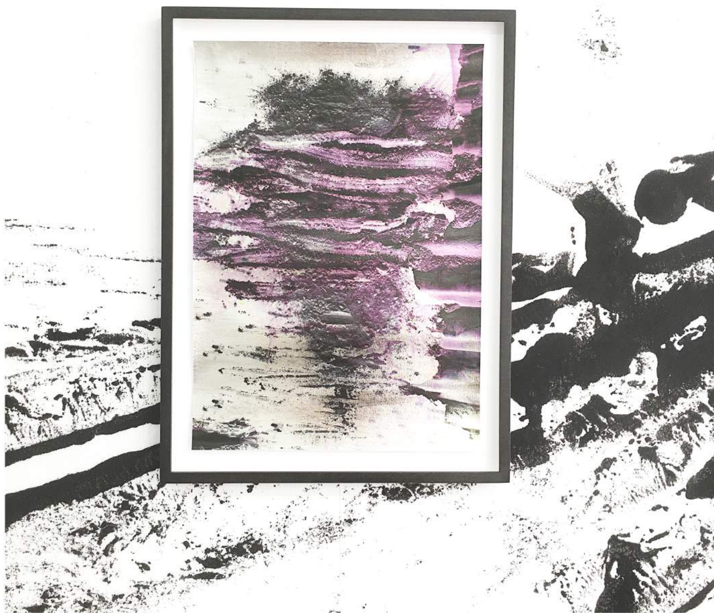
Viking Venus #04 (2022) Archival pigment print | 120 x 80 cm Edition: 3 + 1 AP | €5.600,-