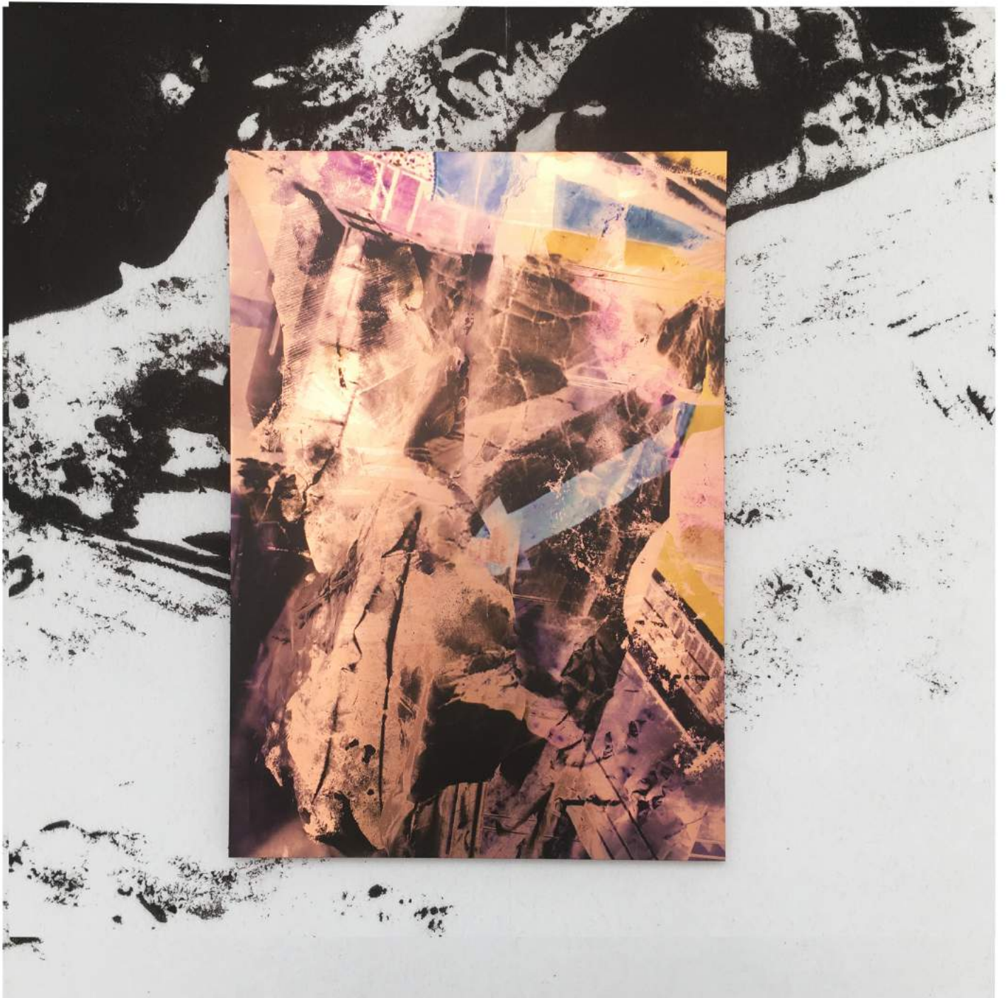
Urban Memories #21 (2022) UV-direct print on copper | 42 x 29,7 cm Unicum | €1.200,-