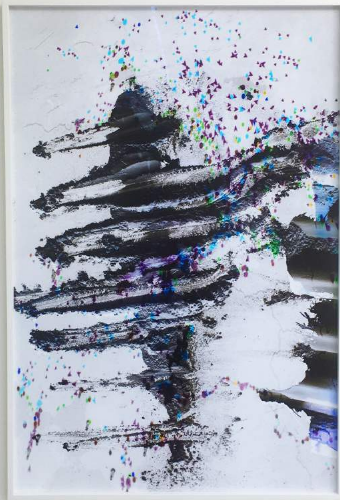
Viking Venus #04 (2022) Archival pigment print | 120 x 80 cm Edition: 3 + 1 AP | €5.600,-