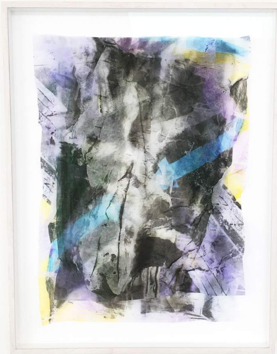
Viking Venus #04 (2022) Archival pigment print on Japanpapier, double layered Unicum | 70 x 52 cm | €3.600,-