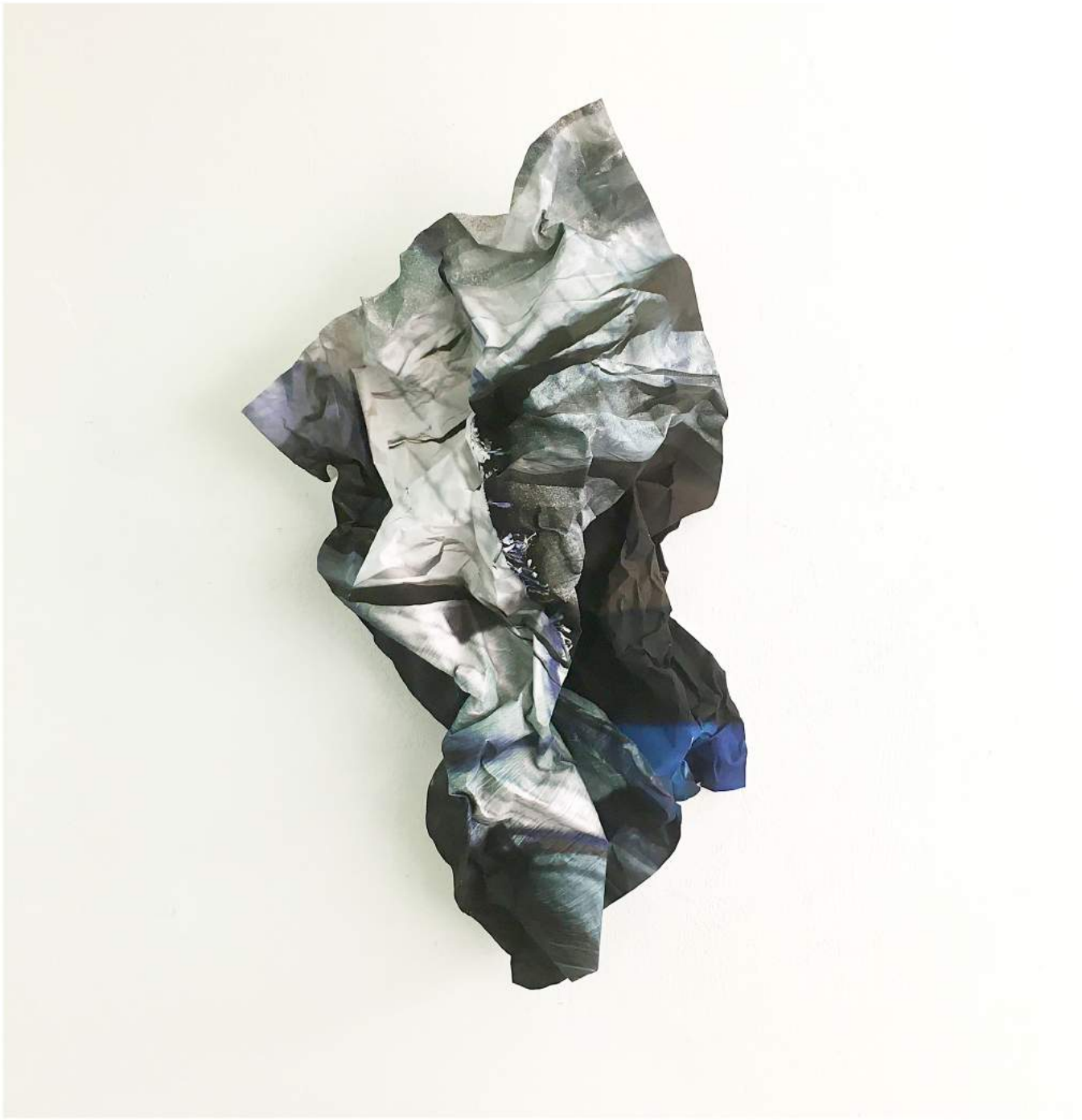
I remember bords and stones #03 (2022) | Archival pigment print on aluminum 74 x 42 cm | Unicum from series of 3 | €2.400,-