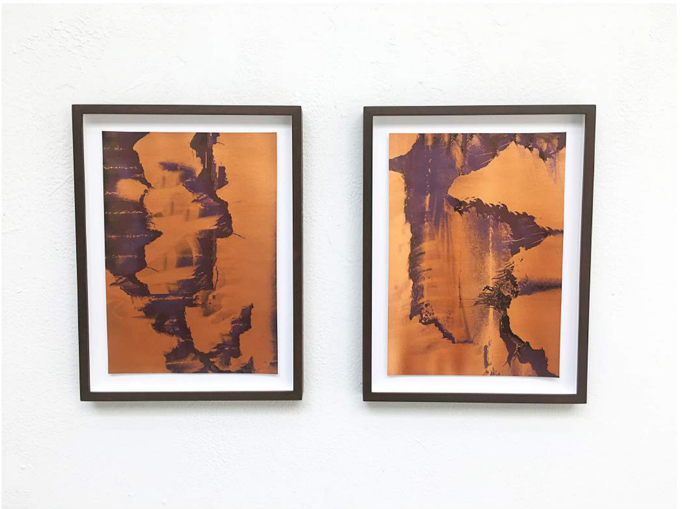
Urban Memories #17 (2023) Archival pigment print on bronze | 37 x 26 cm Ed. 3 + 1 AP | €2.200,-