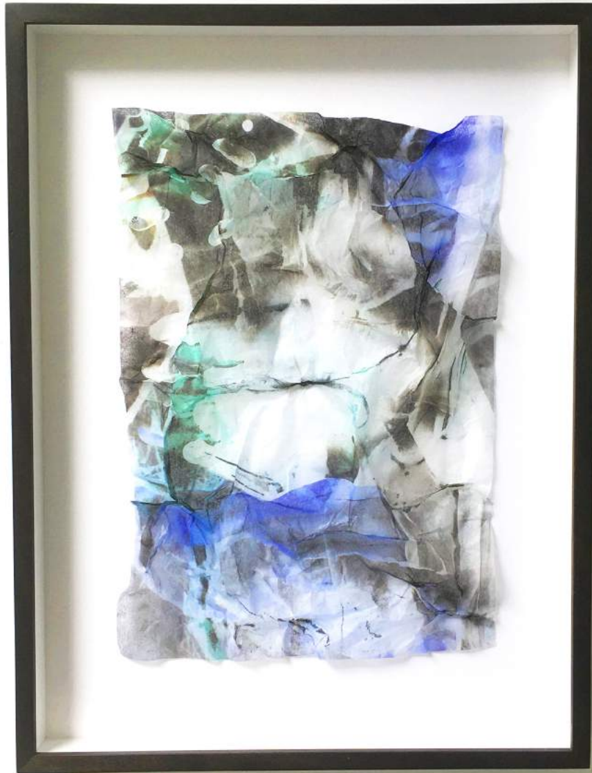
Viking Venus #11 (2022) Archival pigment print on Japanpapier | 37 x 26 cm Unicum from a series of 3 | Ed. 2/3 | €2.200,-