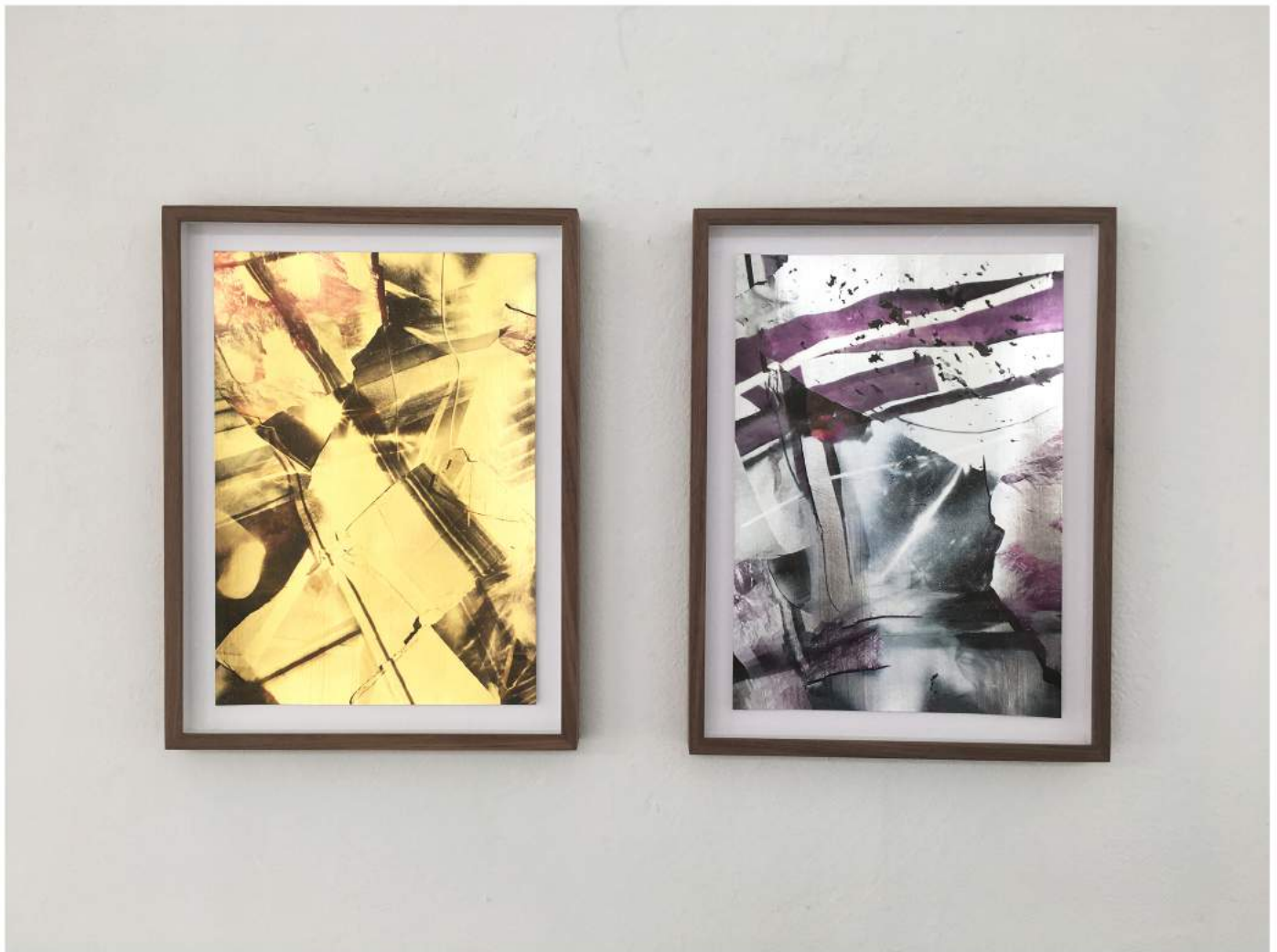
Viking Venus #26 (2022) Archival pigment print on gold 29,7 x 21 cm | Unicum from a series of 3 | Ed. 1/3 €2.400,-