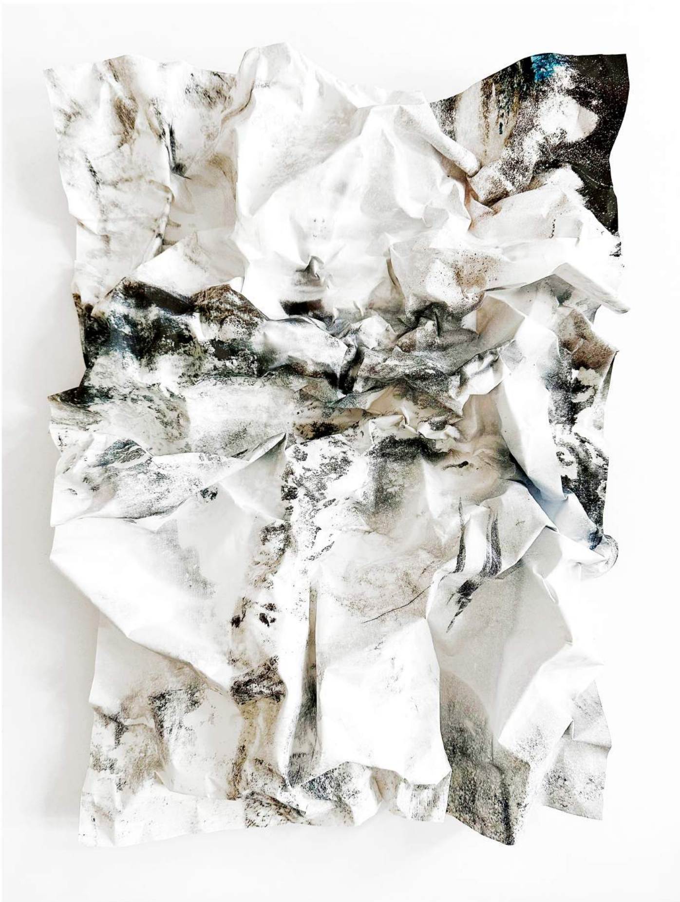
Urban Memories #08 (2023) Archival pigment print on aluminium | 68 x 46 cm unicum | €2.400,-