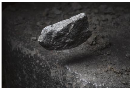
Test Site I