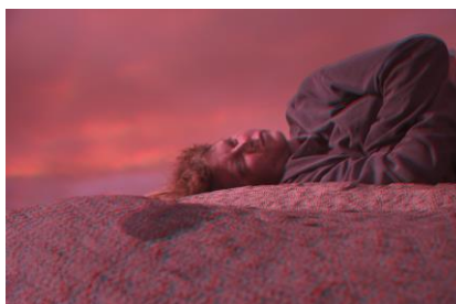
Pink Desert X