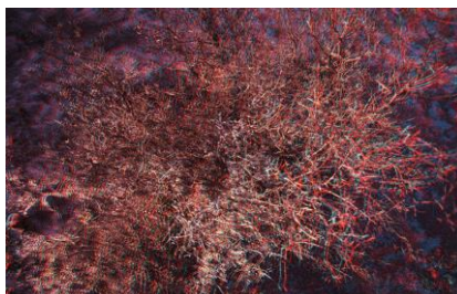
Pink Desert VIII