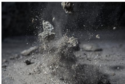
Test Site III