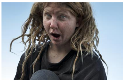
Pink Desert II