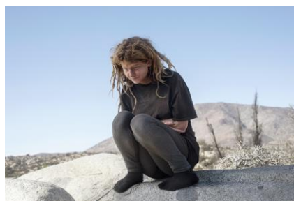
Pink Desert III