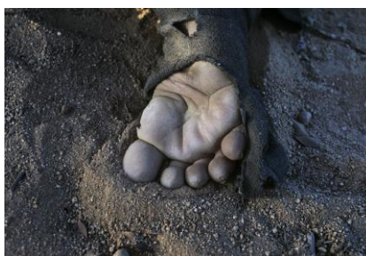
Pink Desert VI