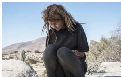
Pink Desert I

Edition 9 + 2 AP Edition 5 + 2 AP Edition 3 + 2 AP