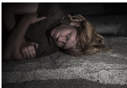
Pink Desert IV