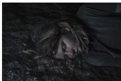
Pink Desert V