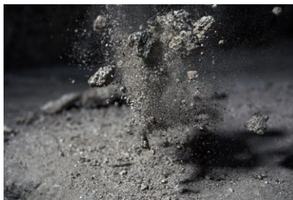
Test Site IV