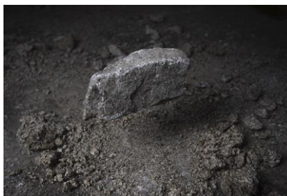
Test Site II