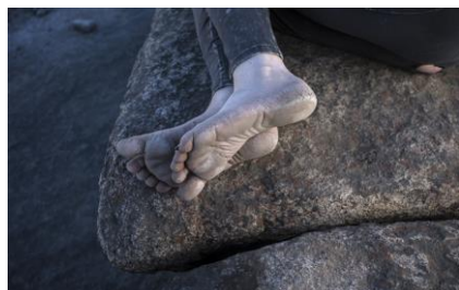
Pink Desert VII